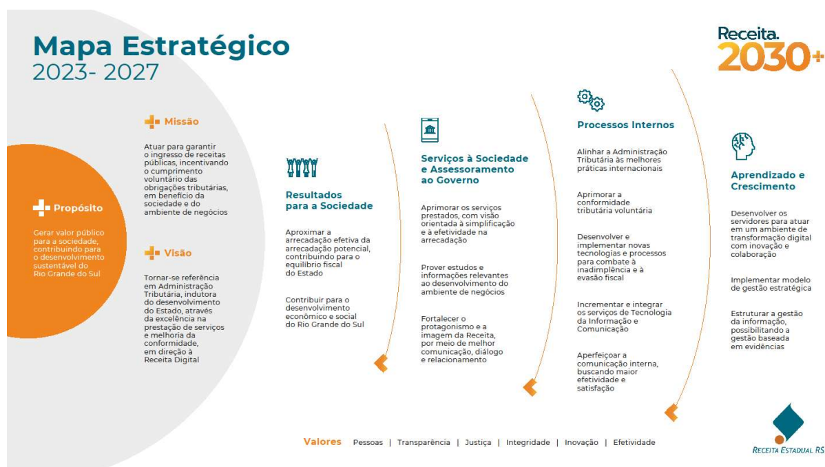
Figura 1: Mapa Estratégico da Receita Estadual 2023-2027.

O Planejamento Estratégico da Receita Estadual, elaborado para o período de 2023 a 2027, é representado pelo Mapa Estratégico apresentado a seguir. O Mapa estabelece como propósito da instituição "gerar valor público para a sociedade, contribuindo para o desenvolvimento sustentável do Rio Grande do Sul" .