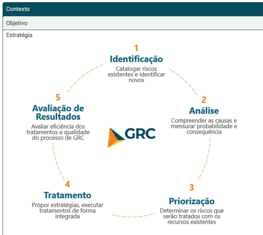
Figura 4: Processo de Gestão de Risco de Conformidade da Receita Estadual, baseado na proposta da União Europeia.

Inspirada na metodologia proposta pela União Europeia , a Receita Estadual iniciou a implementação de um modelo de gestão de riscos, com etapas voltadas à construção de um contexto operacional, à identificação, à valoração dos riscos de conformidade e definição e tratamentos. O objetivo inicial foi identificar os principais riscos que impactam a fiscalização, a partir da qual estão sendo desenvolvidos Planos de Melhoria da Conformidade (PMCs). A etapa atual consiste na elaboração e implementação dos PMCs, que são análises e proposição de estratégias estruturadas que visam reduzir os riscos tributários identificados, promovendo o aumento da conformidade tributária.