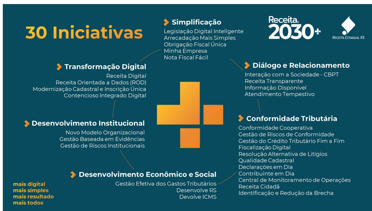
Figura 2: Iniciativas do Receita 2030+.

Essas iniciativas, constantes do Receita 2030+, se materializam por meio de diversos projetos que têm como objetivo alcançar o patamar de uma Receita Digital, mais moderna, simples e eficiente, voltada ao bem-estar da sociedade gaúcha.